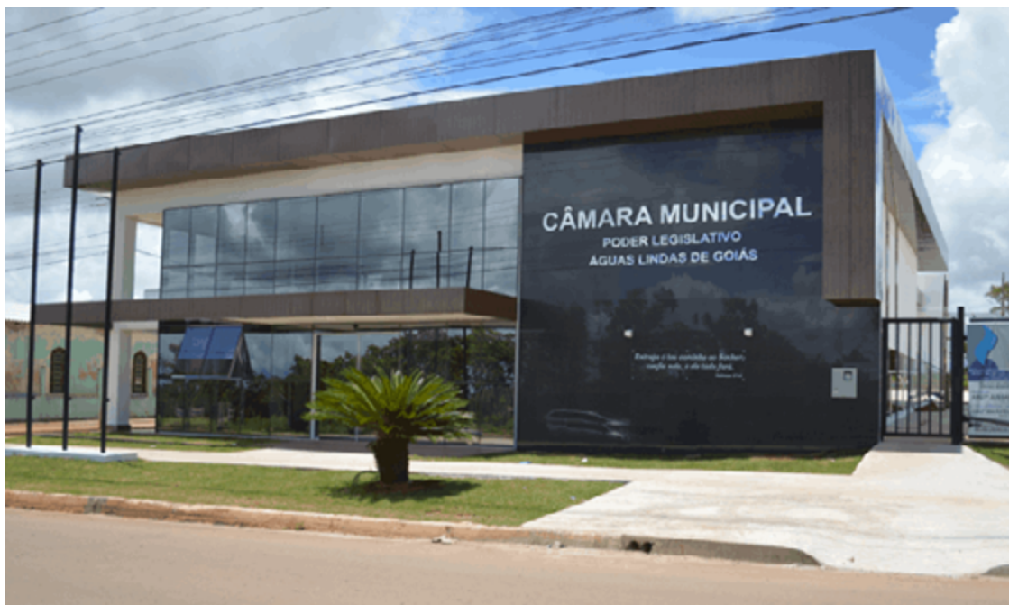
O evento ocorre na Câmara Municipal de Águas Lindas de Goiás, a partir das 8h30, e vai contar com palestras gratuitas.

Entre os objetivos, estão reforçar a legislação vigen-