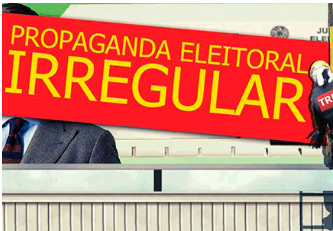
Pré-candidatos não podem promover eventos de rua e pedir votos na pré-campanha

O pedido explícito de voto nos atos de pré-campanha é proibido por lei. Ou seja, o uso