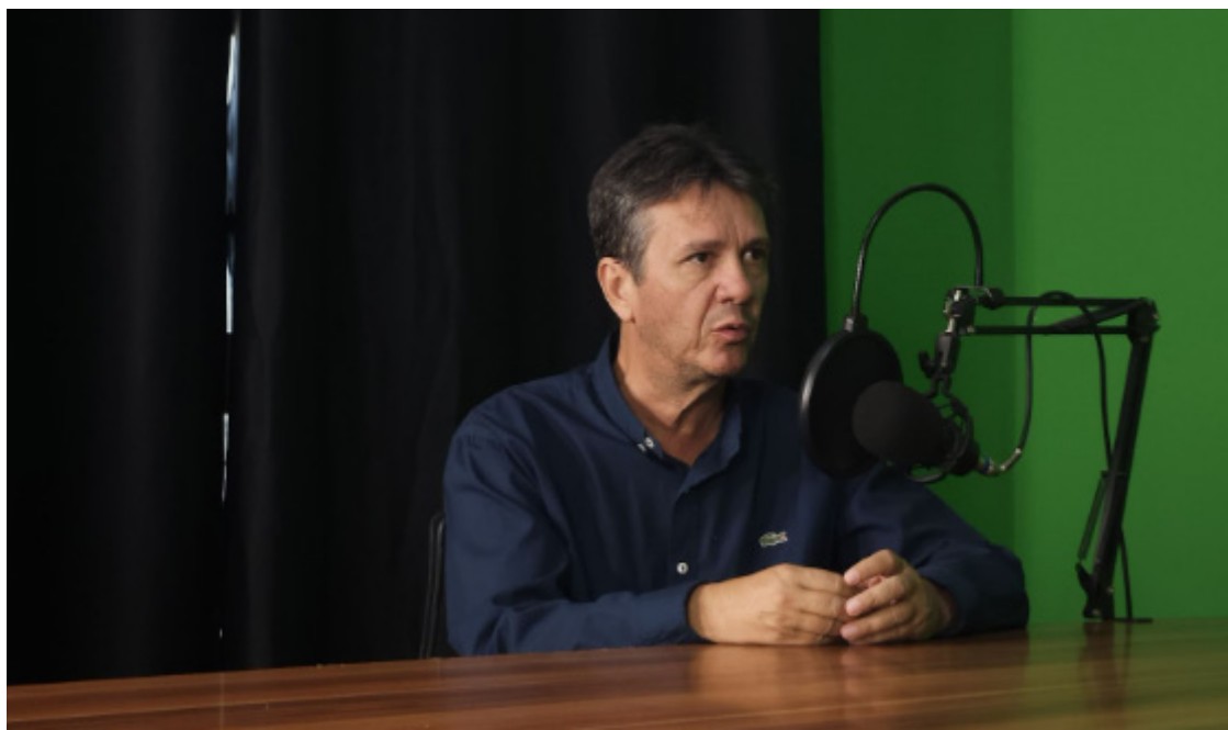
Prefeito de Bom Jardim de Goiás, Willian Gregório (UB)

Além disso, de acordo com o prefeito, foram revitalizados todos os postos de saúde e a fachada da Escola Municipal Dimas Nasser, que também recebeu projetores para as salas