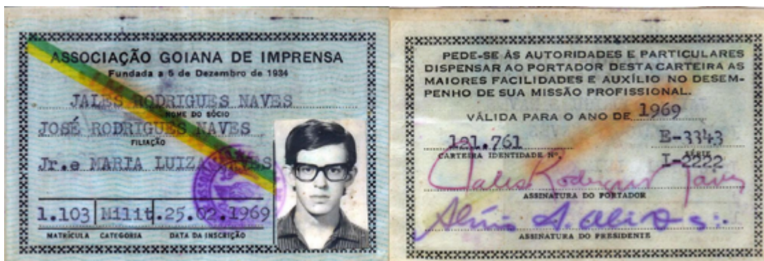
Carteira da AGI, de 1969: ingresso quase simultâneo ao início na graduação pela UFG