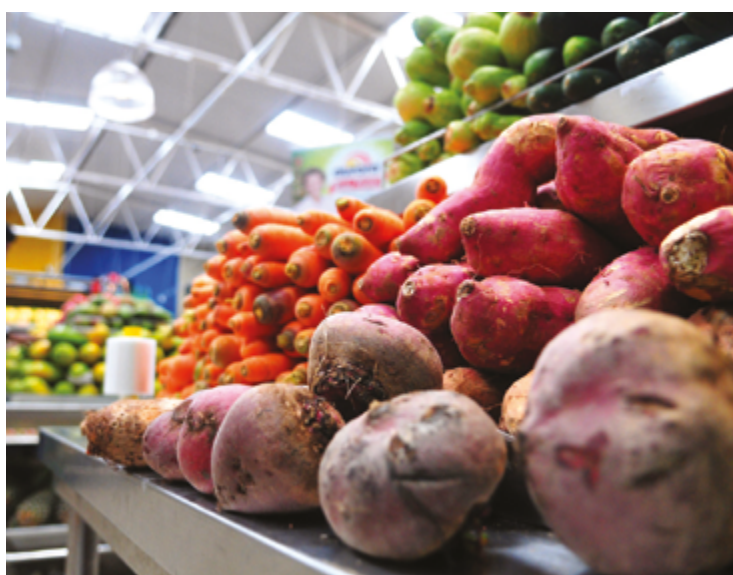
Nutricionista oncológica diz que alimentos ruins funcionam como gatilho para desenvolvimento de doenças