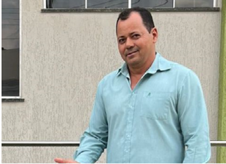
Prefeito Milton Lemes: líder em Araçu com ampla vantagem

01) Em outubro teremos eleição. Se a eleição fosse hoje, em quem você votaria para prefeito de Araçu? (Espontânea)