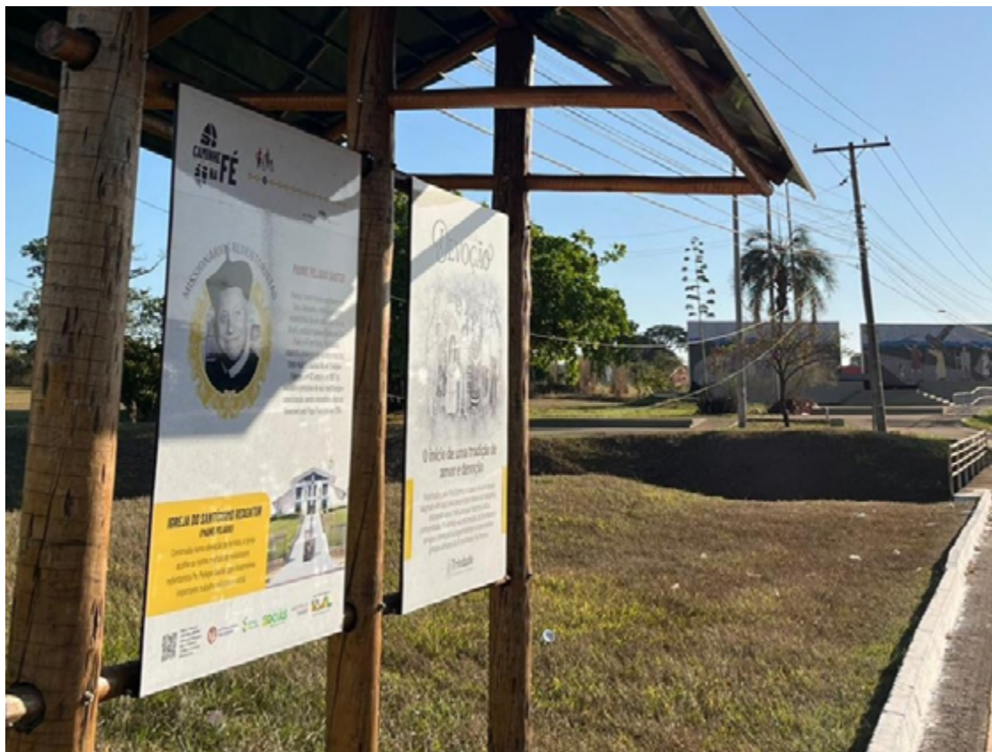
Dispostos pelo Governo, painéis informativos narram história da Romaria ao Divino Pai Eterno