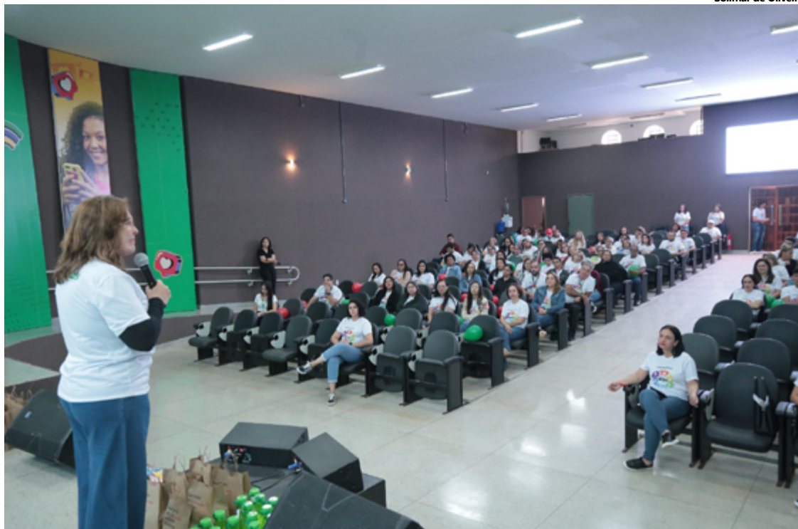
A abertura do evento foi realizada pela secretária de Estado da Educação, Fátima Gavioli, que ressaltou a importância de se dar continuidade às ações da secretaria

A abertura do evento foi realizada pela secretária de