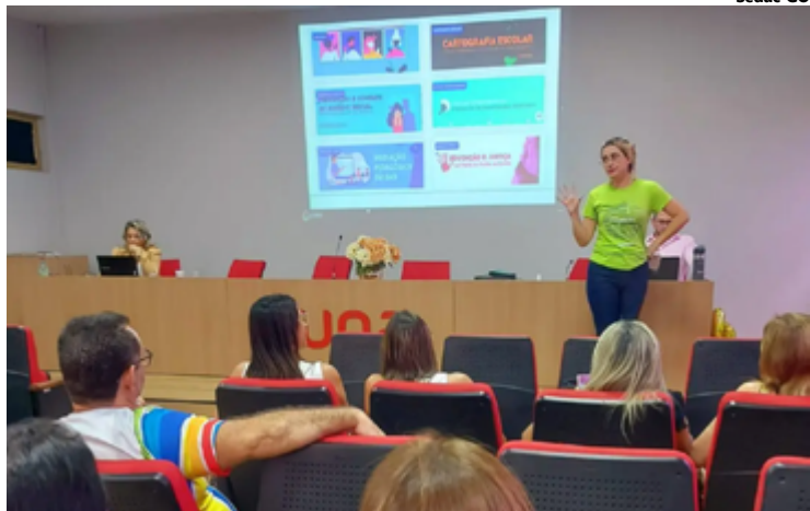
Professores e servidores administrativos da SEDUC em atividades de aperfeiçoamento: melhoria do serviço prestado à população

O resultado, inédito, corresponde a uma média de 75 horas por colaborador da Secretaria de Estado da Educação (SEDUC)