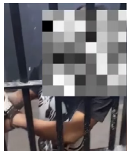
Diante da resistência do indivíduo, ele foi preso em flagrante

Os agentes da GCM ressaltam a importância de conscientização sobre os perigos de dirigir sob influência de álcool.