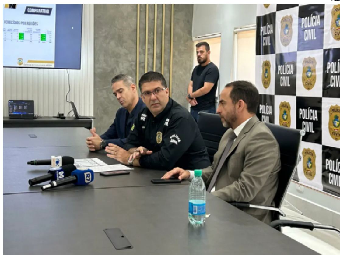
Operação Keres foi realizada de 29 de maio a 21 de junho, coordenada pela Delegacia Estadual de Investigação de Homicídios

De acordo com o balanço apresentado, a operação resultou no cumprimento de 154 mandados de prisão, 52 mandados de busca e apreensão e a conclusão e envio ao Poder Judiciário, com autoria defini-