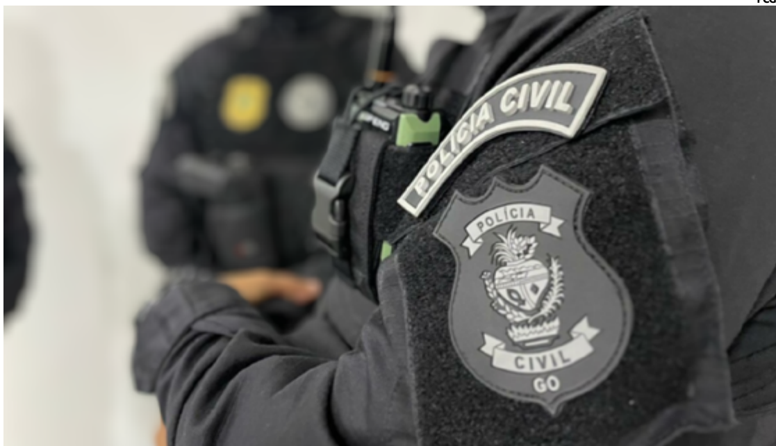
O suspeito foi localizado e detido pela equipe da Polícia Civil em sua residência em Formosa

O cumprimento do mandado de prisão preventiva foi realizado após a equipe do Grupo de Investigação de Homicídios receber informações de que o investigado havia descumprido uma medida cautelar imposta anteriormente. Essa medida proibia qualquer contato do suspeito com as testemunhas do caso. Apesar dessa determinação judicial, o investigado enviou áudios ameaçadores a uma das testemunhas, intensificando as preocupações das autoridades sobre a integridade física e