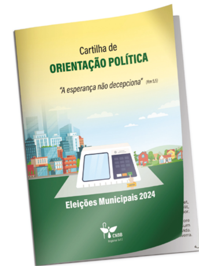
Cartilha aborda ‘A esperança não decepciona’ e faz defesa da democracia

O documento ressalta ainda que candidatos são adversários e não inimigos, e que a disputa eleitoral não é um campo de guerra. “Quando candidatos agem como inimigos, o resultado é desastroso para a sociedade, pois, em geral, acabam deixando de lado a proposta de governo que tem a oferecer aos eleitores e passam a se